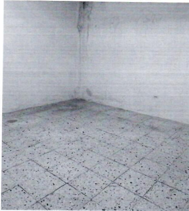
Interior de la bodega