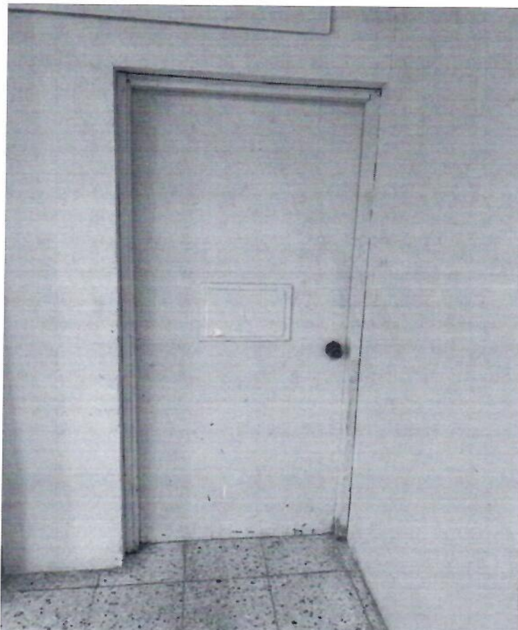
Puerta de madera

Con la finalidad de mostrar cómo se encuentra actualmente las instalaciones de este Consejo que se designaron como bodega electoral, enseguida se presenta una muestra fotográfica del estado actual en que se encuentra: